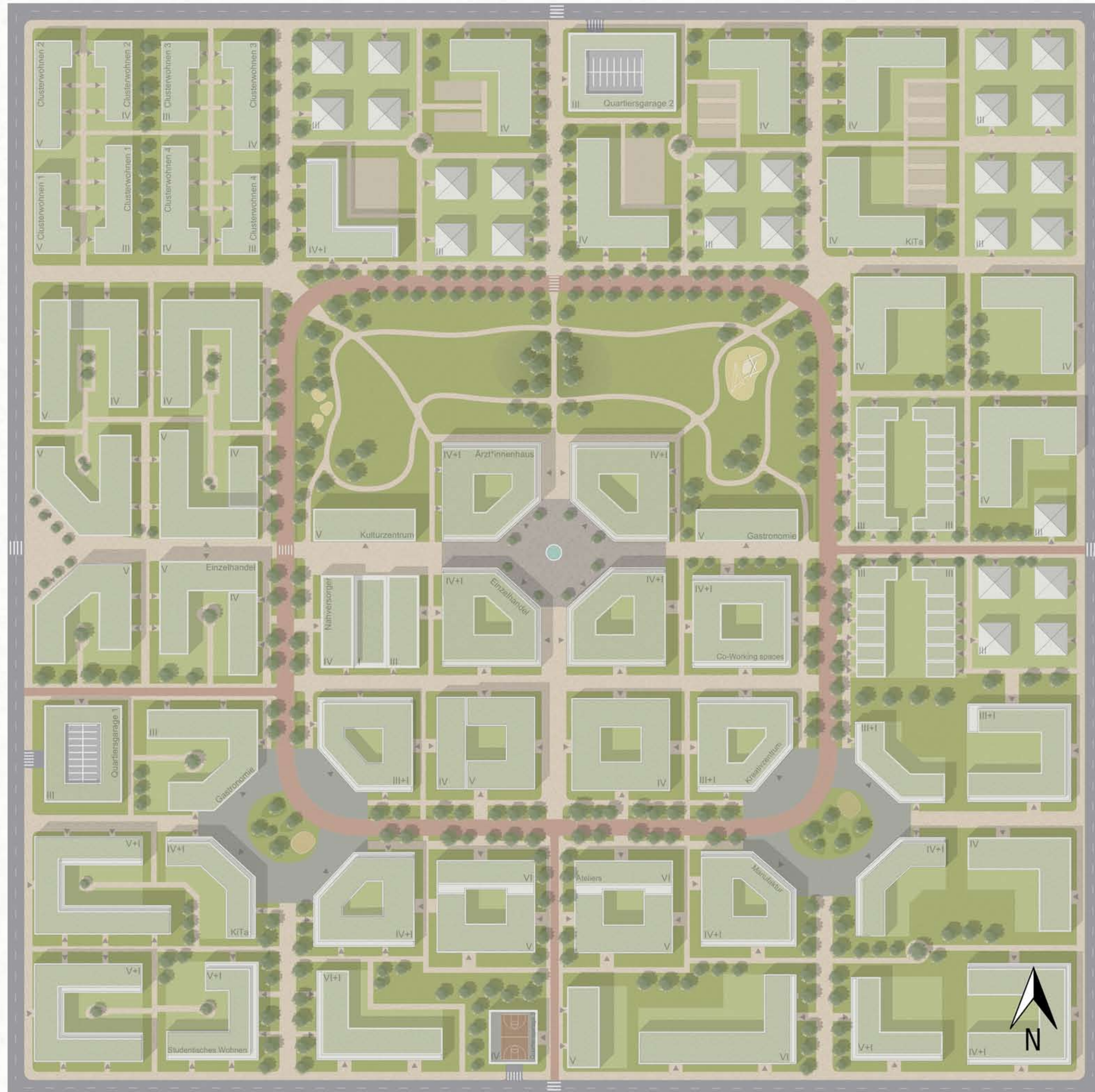
Lageplan Maßstab 1:1000