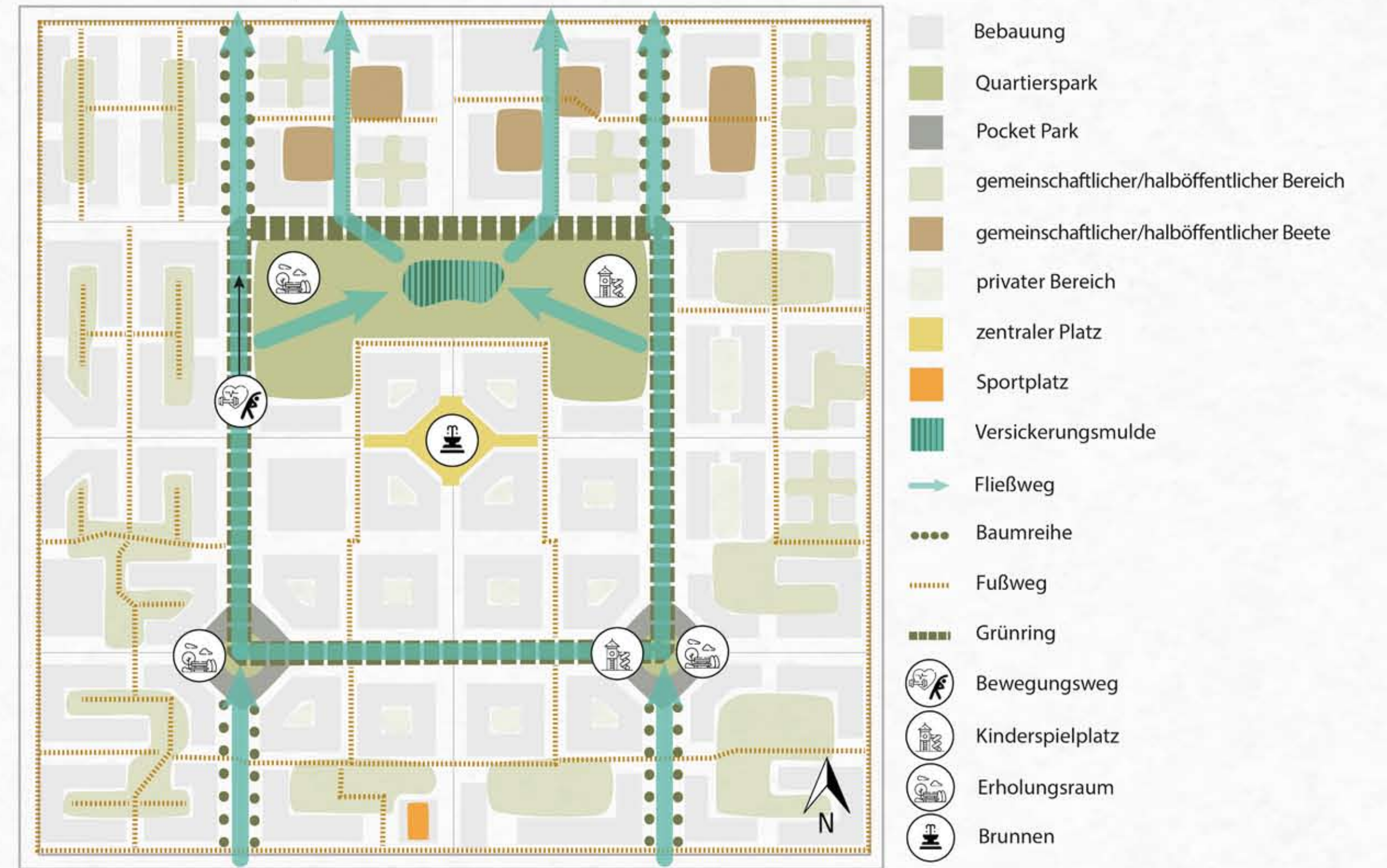
Freiflächenkonzept Maßstab 1:2000