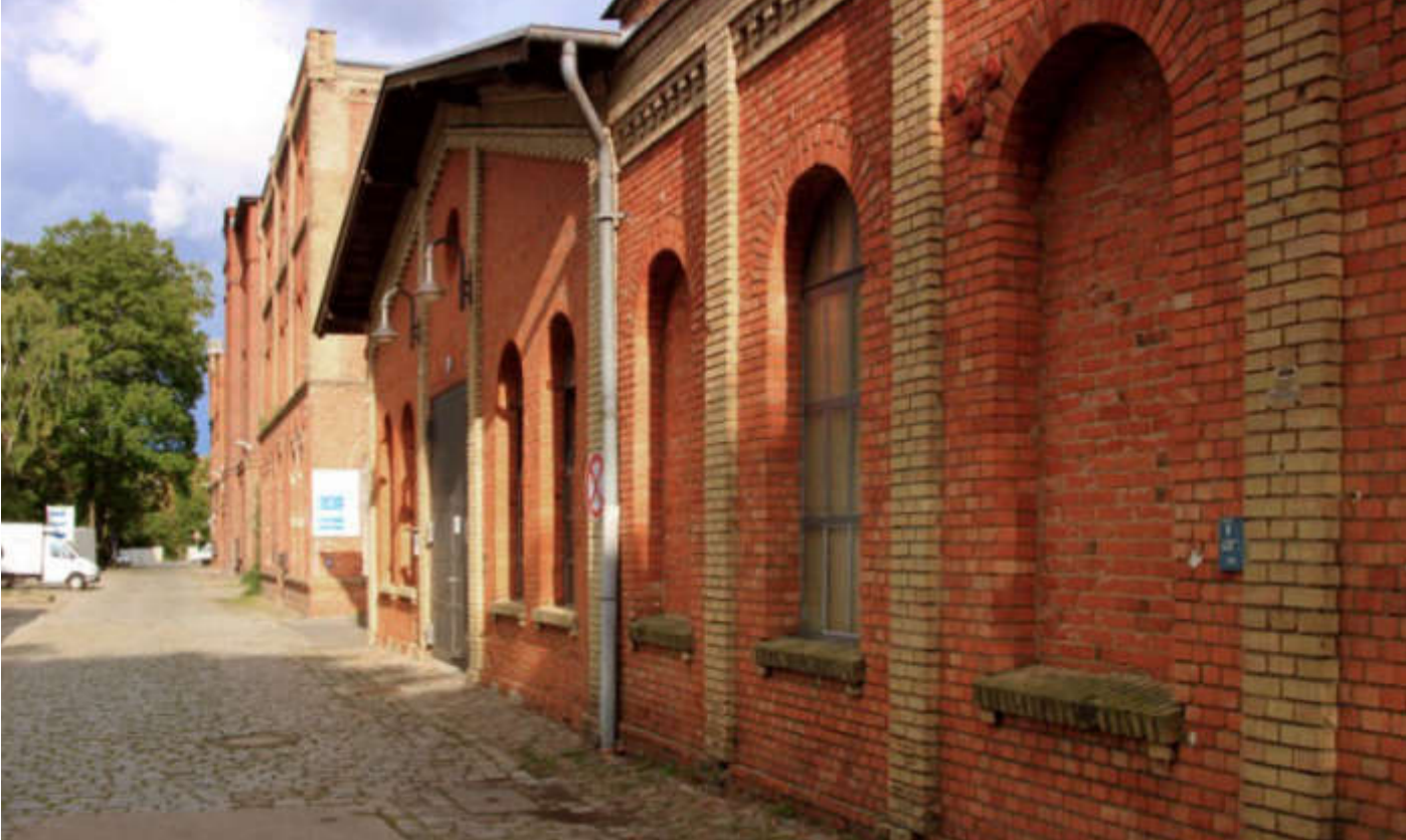
Farben Referenz: Eisenwerder, Berlin