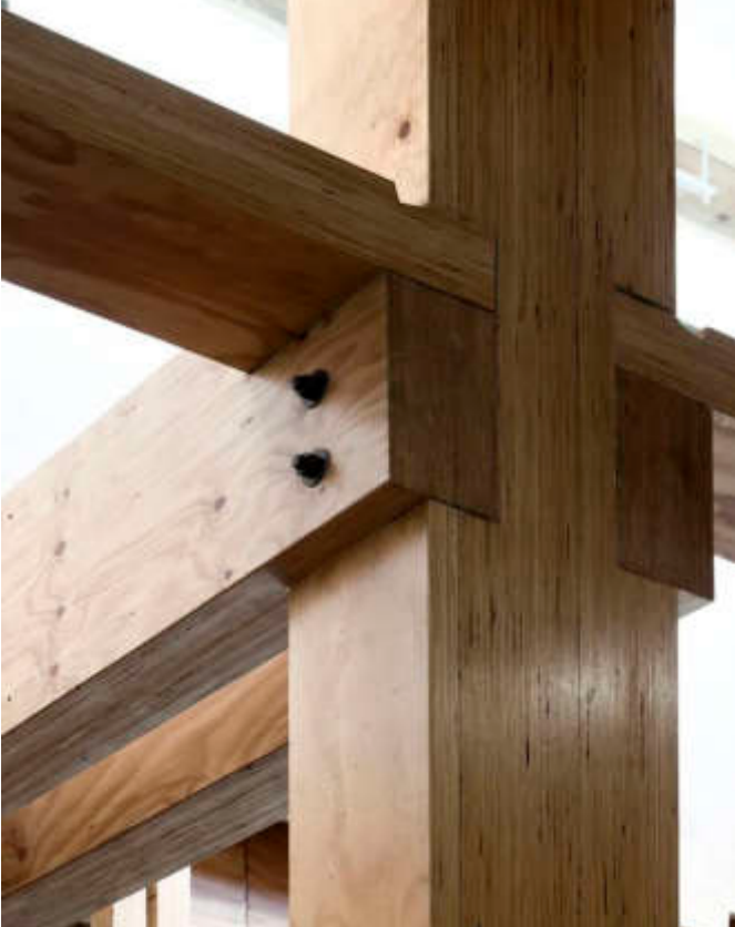
Referenz: Klarheit der Konstruktion