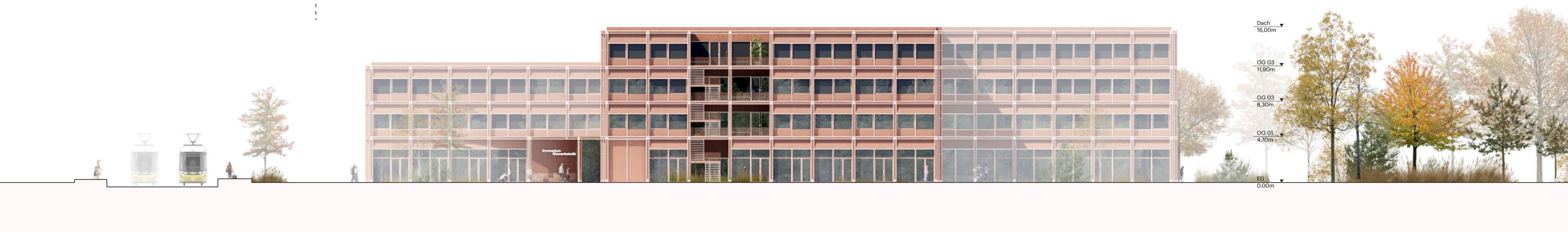
Ansicht Westen 1:200