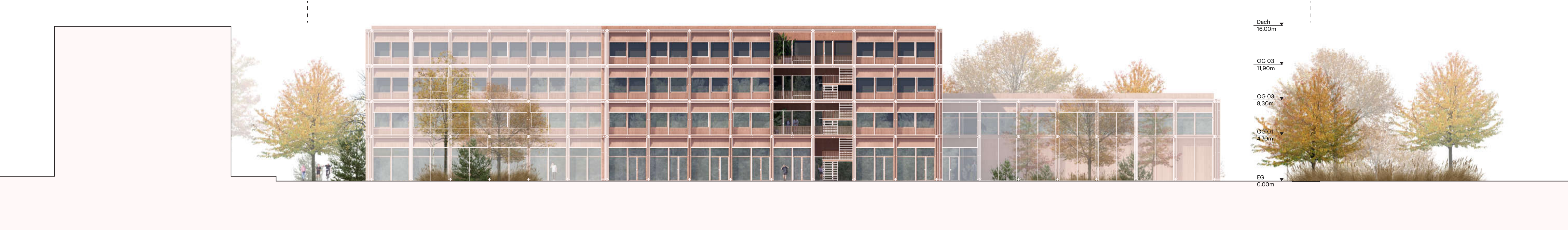
Ansicht Süden 1:200