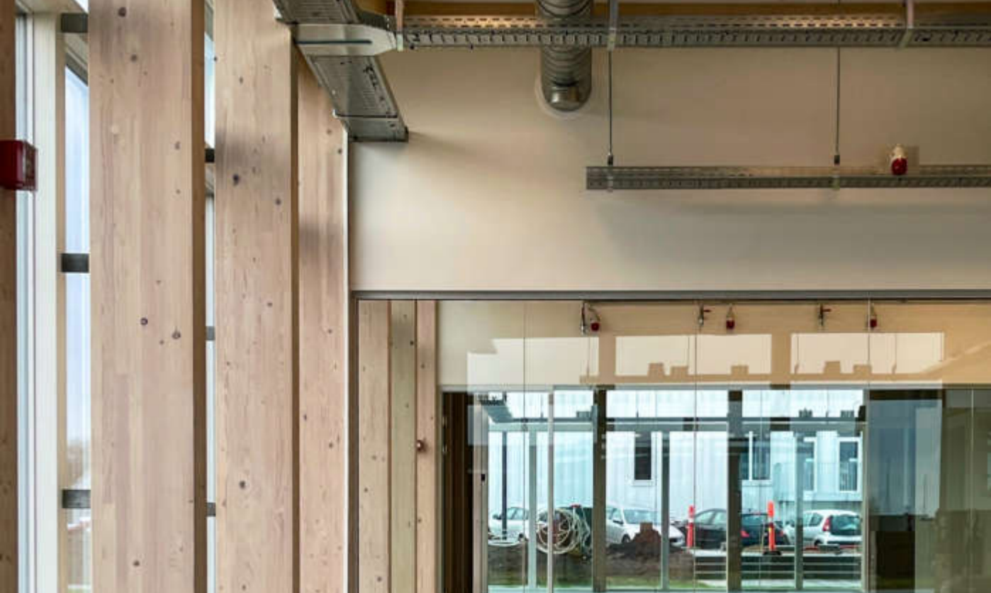
Referenz: Freilegende Holzkonstruktion