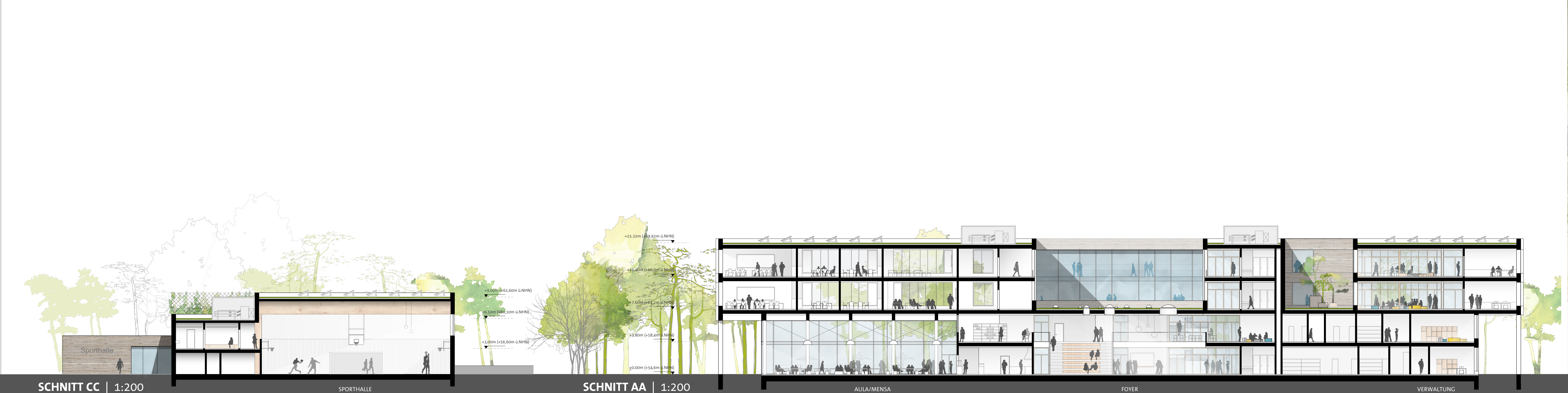
SCHNITT CC | 1:200 SPORTHALLE SCHNITT AA | 1:200 AULAIMENSA Foyer VERWALTUNG