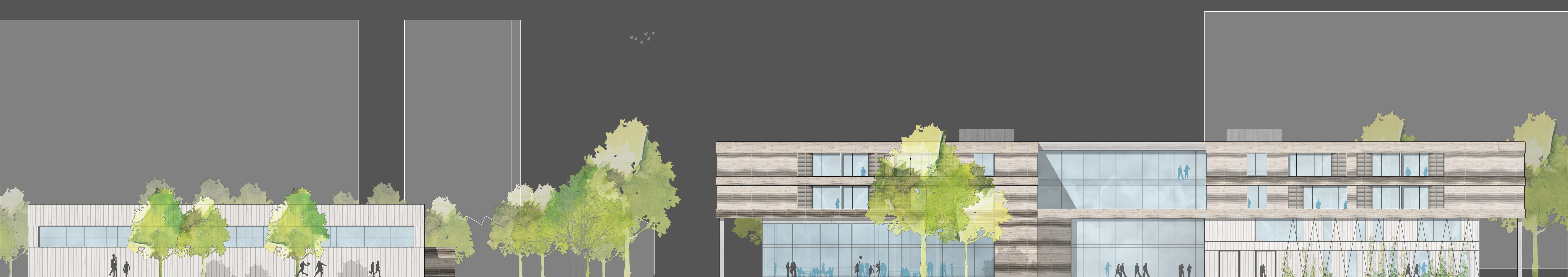
ANSICHT NORD-OST | 1:200