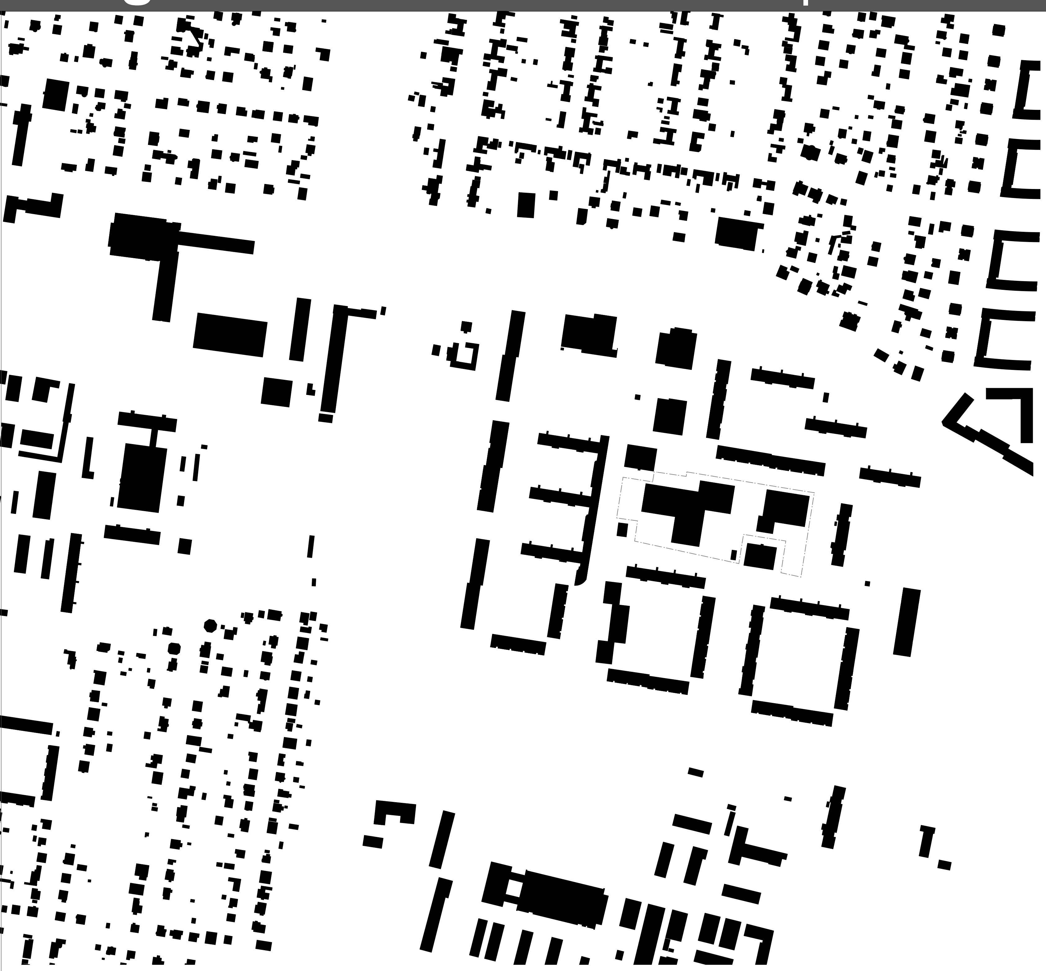
SCHWARZPLAN | 1:2500