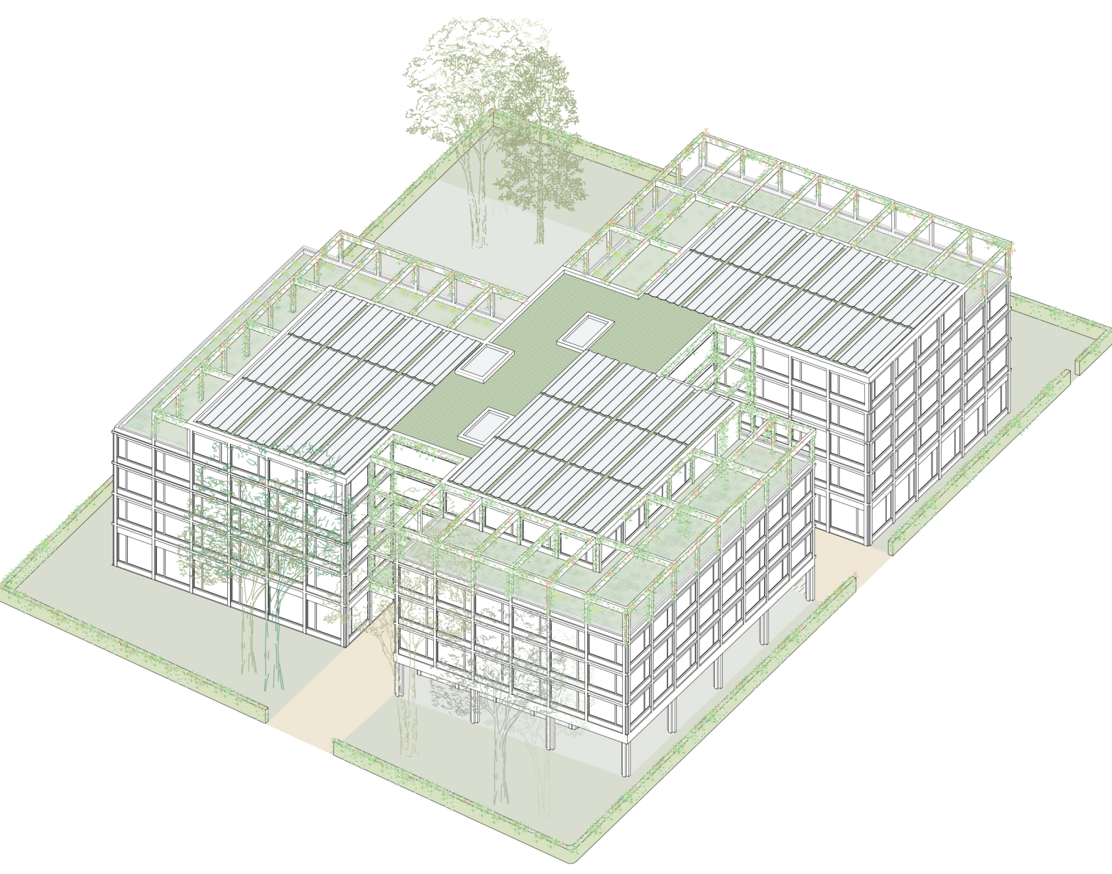
Axonometrie Grüne Dachlandschaft & Gebäudestruktur