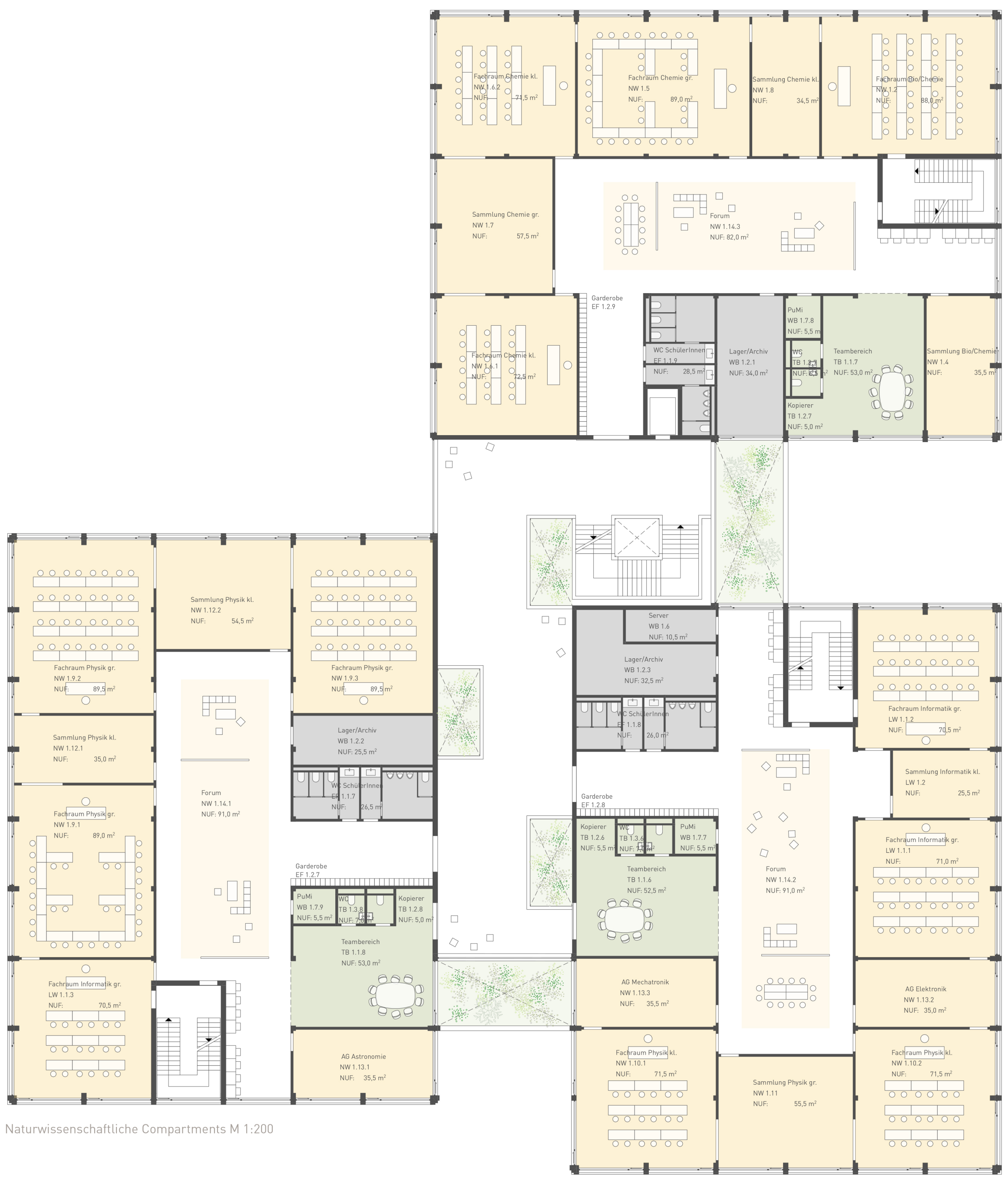
Naturwissenschaftliche Compartments M 1:200