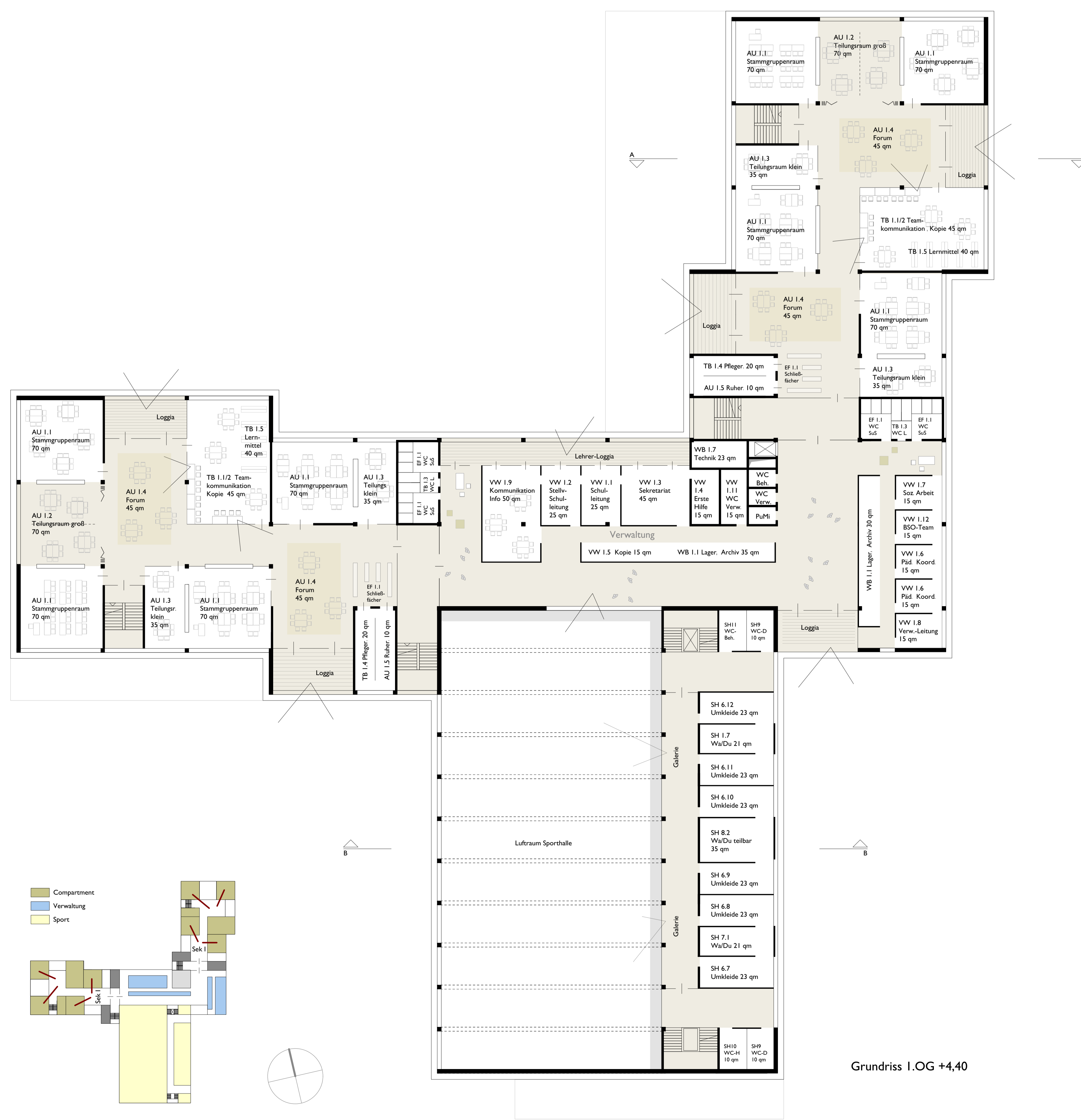
Grundriss 1.OG +4,40