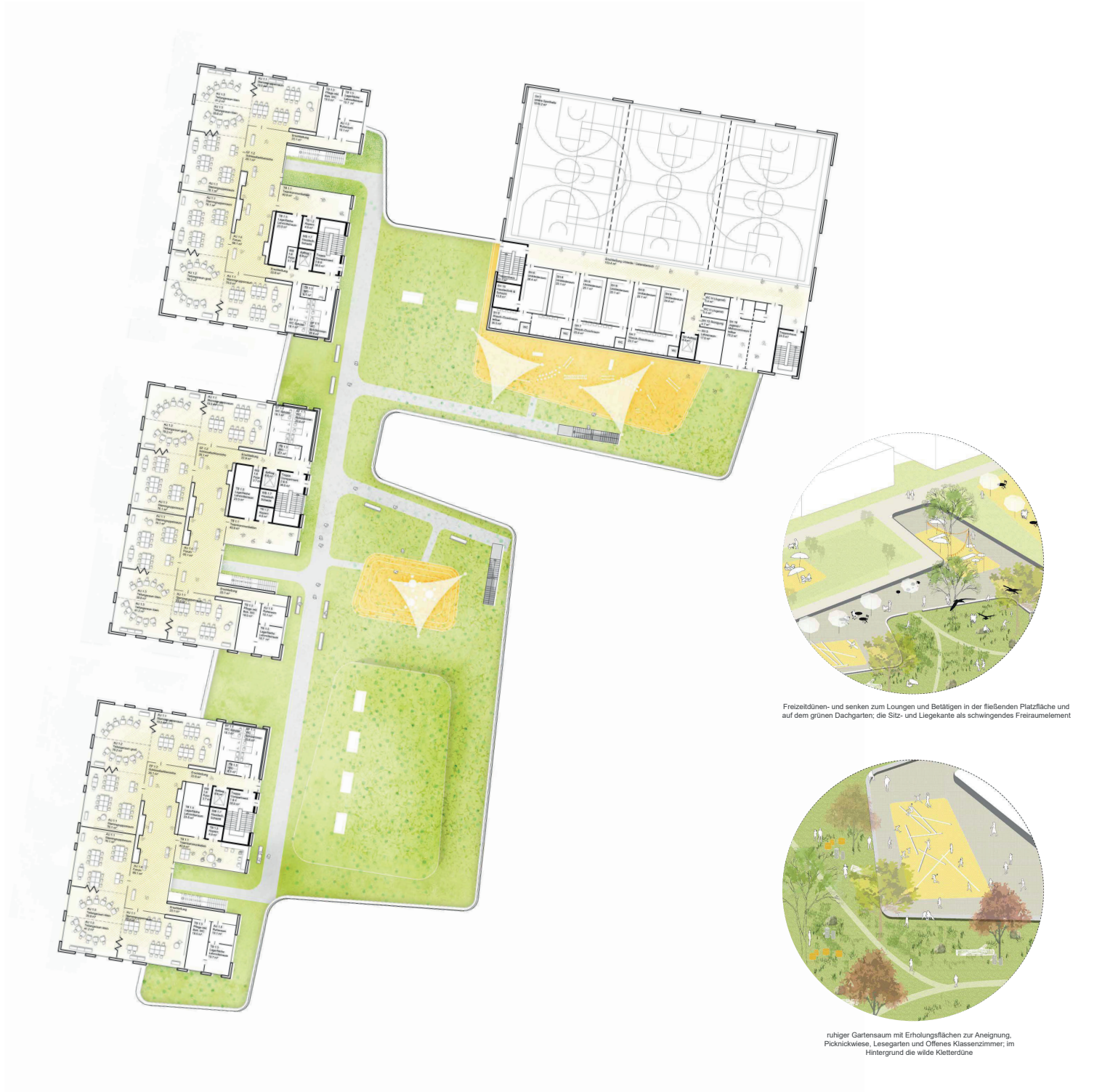
Freizeitdünen- und senken zum Loungen und Betätigen in der fließenden Platzfläche und auf dem grünen Dachgarten; die Sitz- und Liegekante als schwingendes Freiraumelement