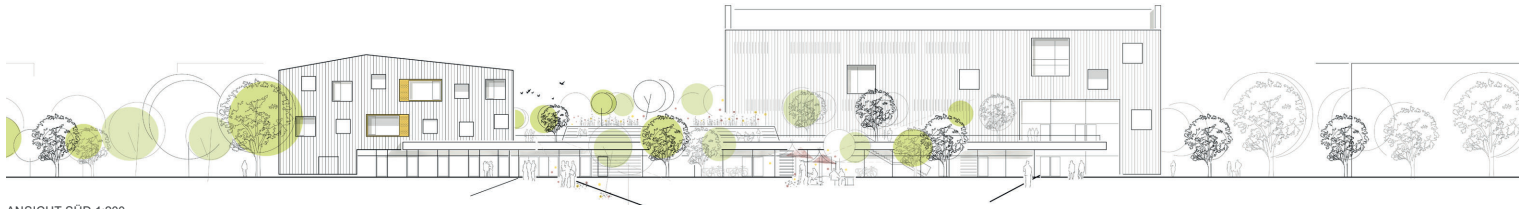
ANSICHT SÜD 1:200