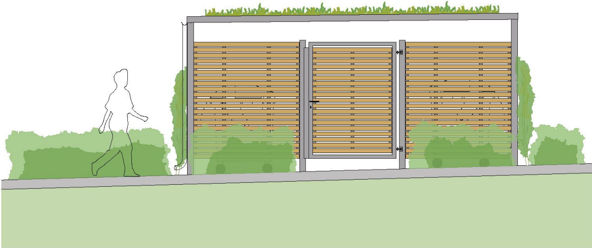
Ansicht A: Eingang Ostseite, M 1:50